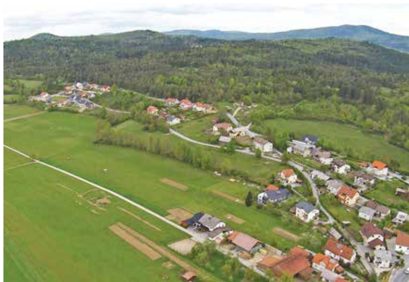
Na občini so letos izdali že devet gradbenih dovoljenj za klasične popolne novogradnje in trinajst dovoljenj za pomožne objekte.

Leta 2008 so podjetja, ki so delovala v gradbeništvu, dosegla skupaj 7,91 milijarde evrov prihodkov od prodaje, leta 2012 pa skoraj polovico manj. Slovenska gradbena industrija se je sicer znašla v težavah že ob osamosvojitvi Slovenije,