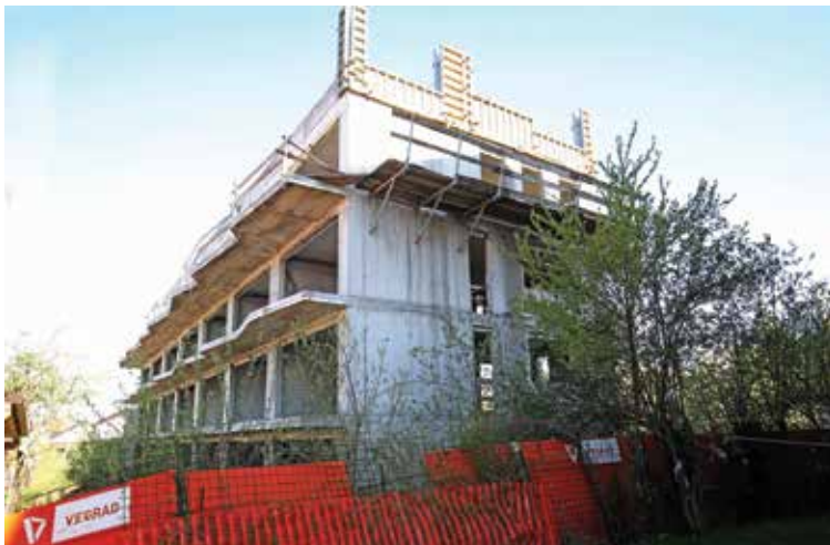
Občina spremlja stanje nedokončanih objektov, ki predstavljajo javni interes.

Po novem ne bo več treba pridobiti gradbenega dovoljenja za odstranitev objektov (potrebna bo samo še prijava začetka gradnje) inčasne objekte. V pomoč investitorjem bo uvedeno obvezno svetovanje upravnih enot. Po predlogu se bodo sedanja soglasja, ki so potrebna pri pridobivanju gradbenega dovoljenja in so samostojni upravni akti, prekvalificirala v mnenja. Ta bo usklajeval upravni organ, ki ne bo več nujno vezan nanje, lahko pa jih bo investitor sam pridobil in jih predložil že zahtevi za izdajo gradbenega dovoljenja, kar bo močno pospešilo postopek.