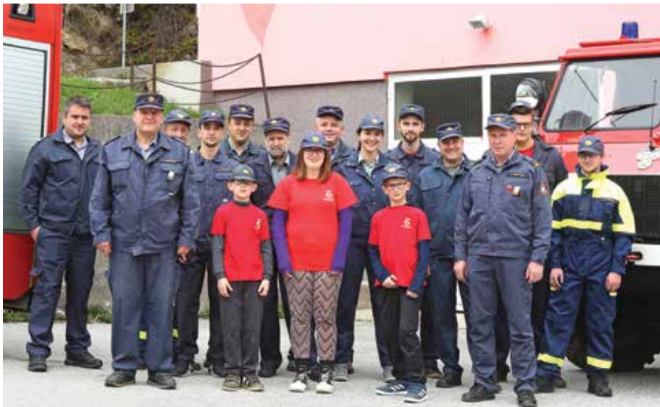
Društvo danes šteje 61 članov.

Po letu 2000 se je skladno z razvojem gasilstva tudi naše društvo aktivneje vključilo v operativno delovanje. Operativni gasilci so se začeli izobraževati za vse zahtevnejše intervencije. Poleg tega pa je začelo društvo dokupovati ustrezno tehnično in varovalno opremo, ki jo potrebujejo operativci za varno in uspešno delo. Društvo je prvo vozilo nabavilo leta 2004. To je bilo gasilsko