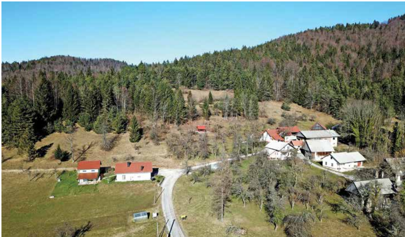
V naročje Vidovske planote ugnezdena vasica. Na pobočju nad vasjo včasih niso bili samo travniki, ampak celo njive.

Jugoslaviji, odločil, da če ga ni, ga bo pa naredil. Najprej ga je zrisal, nato kupil celo stroj. S polnimi žepi je po nabavo šel v Ljubljano in v vsaki trgovini zapravljal »jurja«. Trgovka, ki mu je prodala lep zelen površnik, je malo prehitro ugotovila, da je denar ponarejen. Še preden bi povzročil bančno luknjo, so tiskarju Janezu orožniki natakneli lisice. Iz mariborskega zapora so ga izpustili Nemci. Kaj pa naj bi storili, če jim je pojasnil, da je zaprt, ker je hvalil Hitlerja?