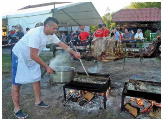
Ideje o tem, s čim bodo postregli obiskovalce, imajo v Grahovem veliko.

V skladu z Zakonom o javnih zbiranjih upravne enote izdajajo dovoljenja, medtem ko policija sprejema prijave javnih prireditev. Vsako veselico je torej treba bodisi prijaviti na policiji ali pa zaprositi za izdajo dovoljenja na upravni enoti. Na upravni enoti mora organizator veselice zaprositi za izdajo dovoljenja v vsakem primeru, če bo veselica potekala na javni cesti oziroma bo potrebna njena zapora; če se bo na veselici uporabljal odprt ogenj oziroma predmeti ali naprave, zaradi katerih je lahko ogroženo življenje ali zdravje ljudi ali premoženje; ali pa se na veselici pričakuje več kot 3000 udeležencev. »V skladu z Zakonom o javnih zbiranjih upravne enote izdajajo dovoljenja, medtem ko policija sprejema prijave javnih prireditev. V primeru gasilskih veselic je potrebno dovoljenje samo v primeru, da je potrebna zapora ceste oziroma je prireditev na ali ob vodi. Za večino gasilskih veselic