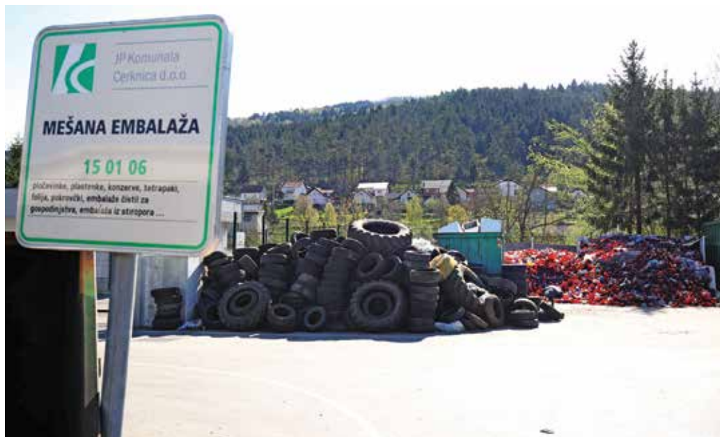
Občani lahko odpadke v zbirni center oddajo brezplačno.