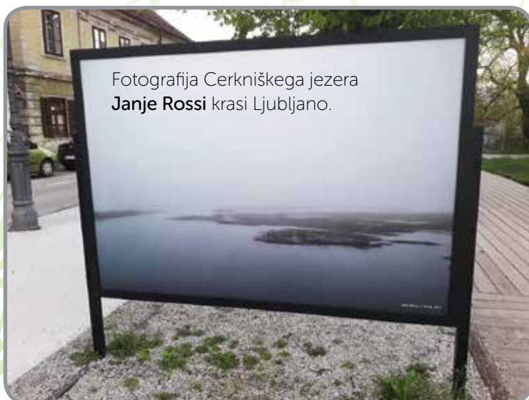
Fotografija Cerkniškega jezera Janje Rossi krasi Ljubljano.