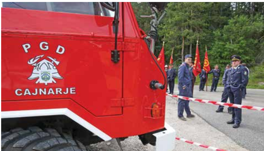
Želijo si, da bi v prihodnje kupili gasilsko vozilo.