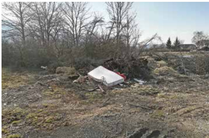
Odpadki ne sodijo v naravo.

Občina Cerknica je zato na lokaciji JP Komunala Cerknica, d. o. o., na naslovu Notranjska cesta 44, Cerknica, uredila zbirni center, kjer lahko povzročitelji odpadkov iz gospodinjstev brezplačno oddajo svoje ločeno zbrane odpadke. V zbirni center lahko pripeljejo: kosovne odpadke (bela tehnika, elektronska in električna oprema, mali gospodinjski aparati, ekrani, oblazinjeno pohištvo), nevarne odpadke (baterije, barve, laki, olja, maščobe, sijalke, zdravila ...), papir in papirno embalažo, plastično embalažo, izdelke iz trde plastike, steklo in stekleno embalažo, lesene odpadke, pohištvo, manjše količine gradbenih odpadkov, stiropor ...). Proti plačilu lahko oddajo tudi manjše količine ustrezno pripravljenih, se pravi ovitih s folijo, azbestno-cementnih odpadkov (salonitk).