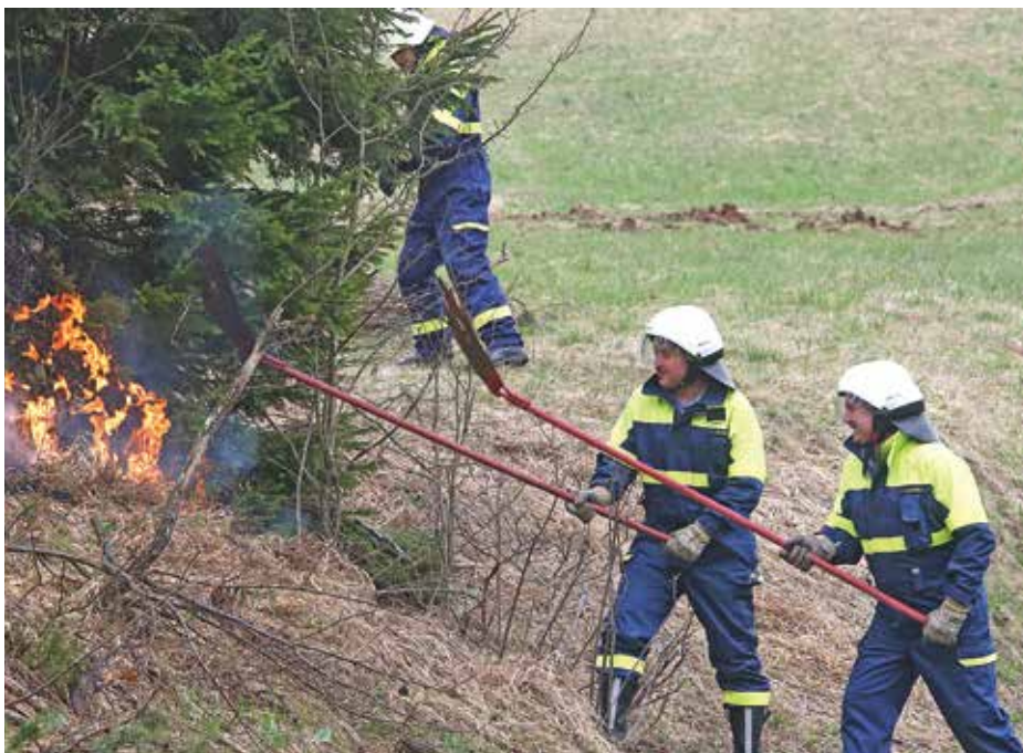
S pionirskimi in mladinskimi ekipami se udeležujemo občinskih in regijskih gasilskih tekmovanj.

Delo društva je močno povezano s krajem in krajanji tudi na drugih področjih. V dvorani gasilnega doma potekajo volitve, v njem organiziramo razne prireditve. Letos smo že drugič s pomočjo zagnanih prostovoljk organizirali proslavo ob materinskem dnevu. Dvorana z lepo okolico in infrastrukturo je primerna za različne dogodke in priložnosti. Možen je najem, verjame mo pa, da bodo z infrastrukturo zadovoljni tudi tisti zahtevnejši. Člani društva se trudimo, da bi pripomogli tudi k aktivnemu dogajanju v Cajnarški dolini. Za vse prebivalce doline, ki so želeli z nami, smo organizirali izlet s kopanjem ter martinovanje. Odločili smo se, da bomo s tovrstnim povezovanjem glede na odziv še nadaljevali, bomo pa veseli, če se nam pridruži še več krajanov.