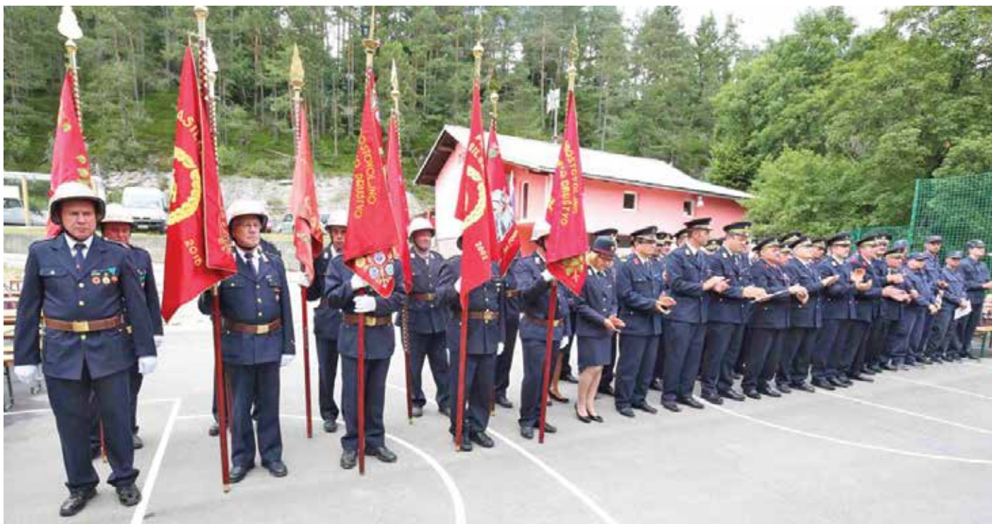
Lansko leto je bilo za njih še posebej slovesno, saj so praznovali 40. obletnico obstoja.

Naši načrti za prihodnost so, da bi se, predvsem mladi gasilci PGD Cajnarje, stalno izobraževali. Tudi dve gasilski vozili, s katerima razpolagamo v društvu, že načenja zob časa, zato si želimo, da bi se tudi naše društvo pridružilo gasilskim društvom v Gasilski zvezi Cerknica, ki so že nakupila nova vozila.