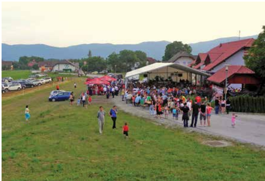
Vsako veselico pa je treba prijaviti tudi na policijo oz. upravni enoti.

»Zadnja dva dneva se dela na polno,« pravi Intiharjeva, »in takrat je bolj malo časa za spanje: postavitve šotora, postavitve odra in okrasitev, ogromno dela imajo električarji z vsemi inštalacijami. Ena ekipa dela s srečelovom, zлага, številci in popisuje nagrade. Postavijo se točilni pulti, uredi se parkirišče,« naštevanju ni konca. Skličejo tudi vso mladino,